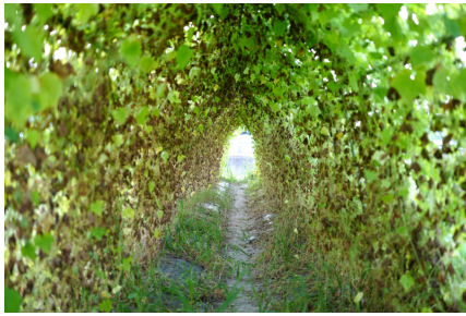
覚道 Road of Enlightenment

仏陀が覚った「悟り」を表現。四苦八苦など、育っていく果実と枯れていく果実、はたまた、空き缶など。この世に見立て、光の先にある出口が希望となるように、未来へ託す作品。