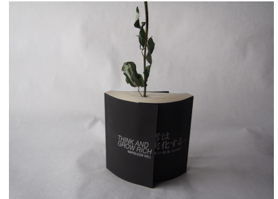
REAL 潜在意識の農業的量子力学 real - agronomic Quantum mechanics Of Subconscious

量子力学的にも人の想いが形になる時、いずれも思考という種があった。「思考は現実化する」という体験は誰もが経験しうるもの。経済発展の中で綺麗に咲く花や枯渇する花、どのような花を育て咲かすかはあなた次第。