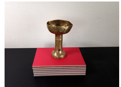
聖杯 HOLY CHALICE

キャンパス、昇華プリント | 2014 2014年ロイヤルパークホテル羽田の一室に常設