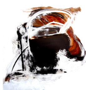
THE GOD FATHER(GUERNIGA) the god father(guerniga)

ピカソが描いたゲルニカにインスパイアを受けて、戦争がいつでも起こりゆるこの世を造った創造主のエネルギーとしての即興アートを自分なりに意図して創作した具象&抽象的、半自動手記による絵画作品。